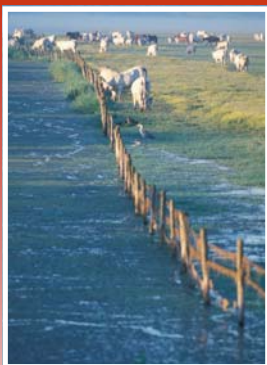
Communal en Vendée

Concrètement, la mise en œuvre du projet se fera en concertation avec les acteurs locaux .