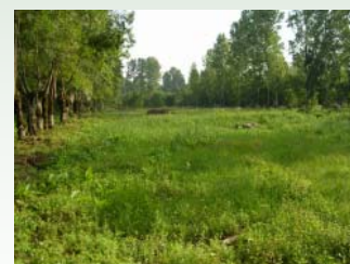
Parcelle avant et après travaux de réhabilitation dans le marais de Saint Georges de Rex - Amuré.