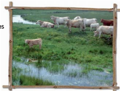
Pâturées ou fauchées, les prairies humides permettent la production de viande ou de lait de qualité.