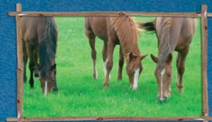
Sans apport d'engrais chimiques, la diversité d'espèces végétales est plus importante.

Le pâturage des prairies en avril, permet de maintenir une végétation rase, favorable à la nidification du Vanneau huppé.